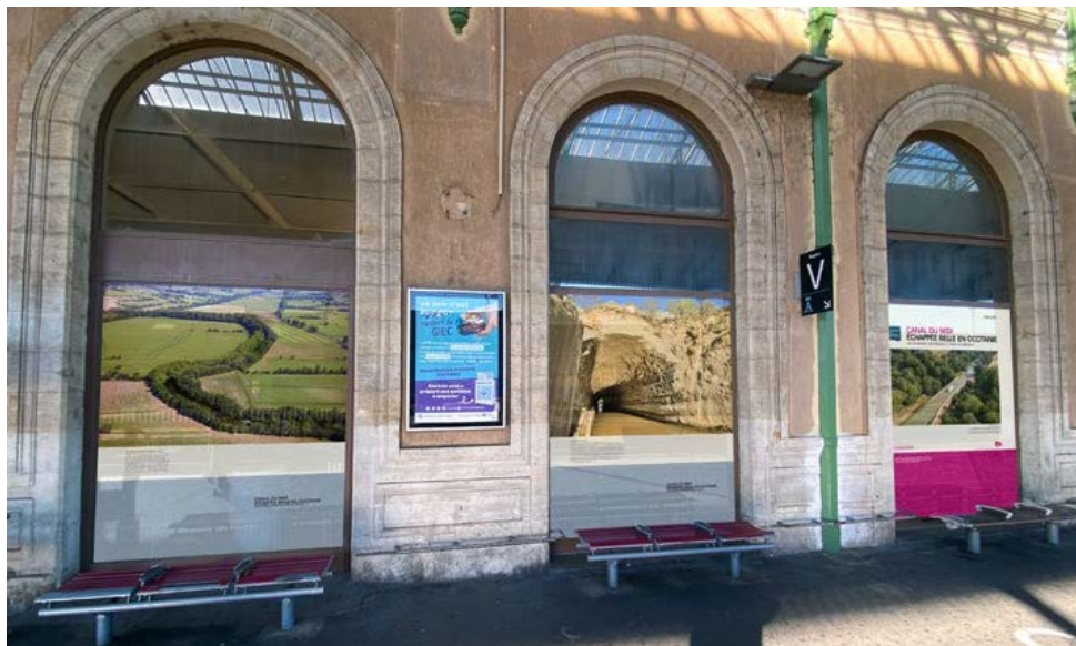
Simulation en gare de Béziers – Prouesse technique