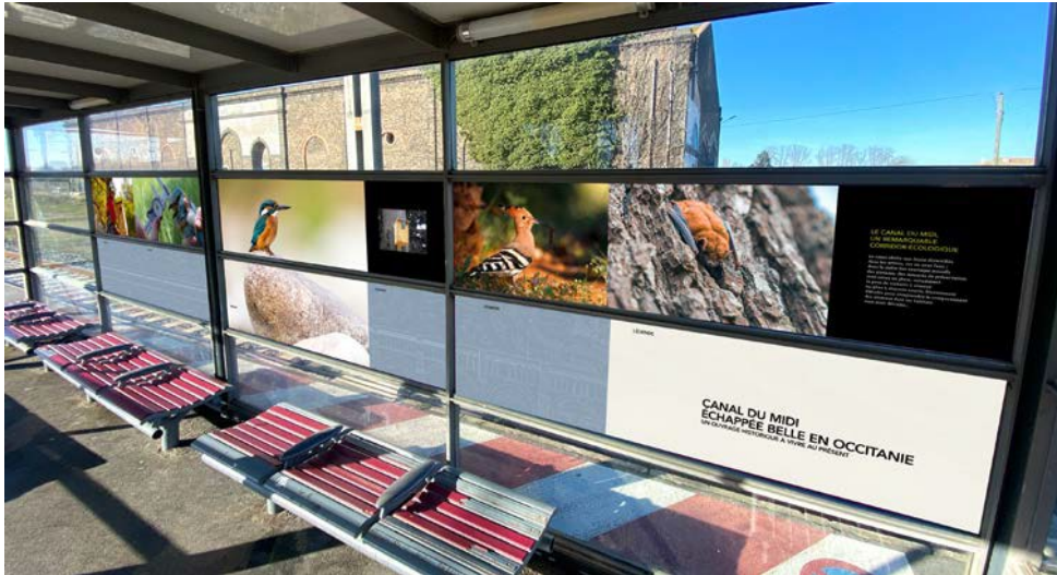
Simulation en gare d'Agde – Paysages, territoires et biodiversité