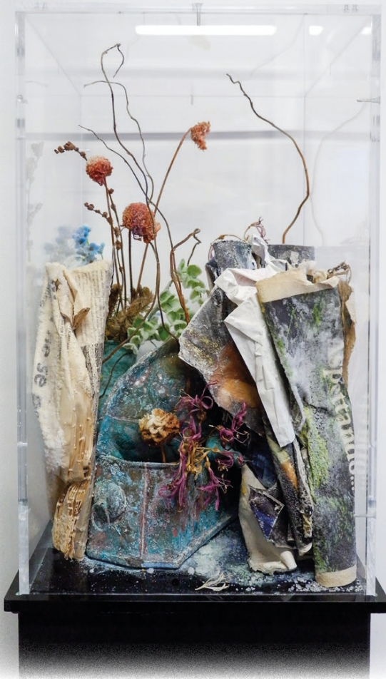
Bianca Bondi, Bloom (rien ne se perd) , 2019, Sculpture, Collections les Abattoirs, Musée - Frac Occitanie Toulouse © Adagh, Paris 2026

Éloge du paysage I et II sont deux expositions voisines qui proposent deux regards complémentaires sur les paysages du canal du Midi : des parcours sensibles où art contemporain, patrimoine et environnement se rencontrent pour révéler la richesse et la fragilité du vivant.