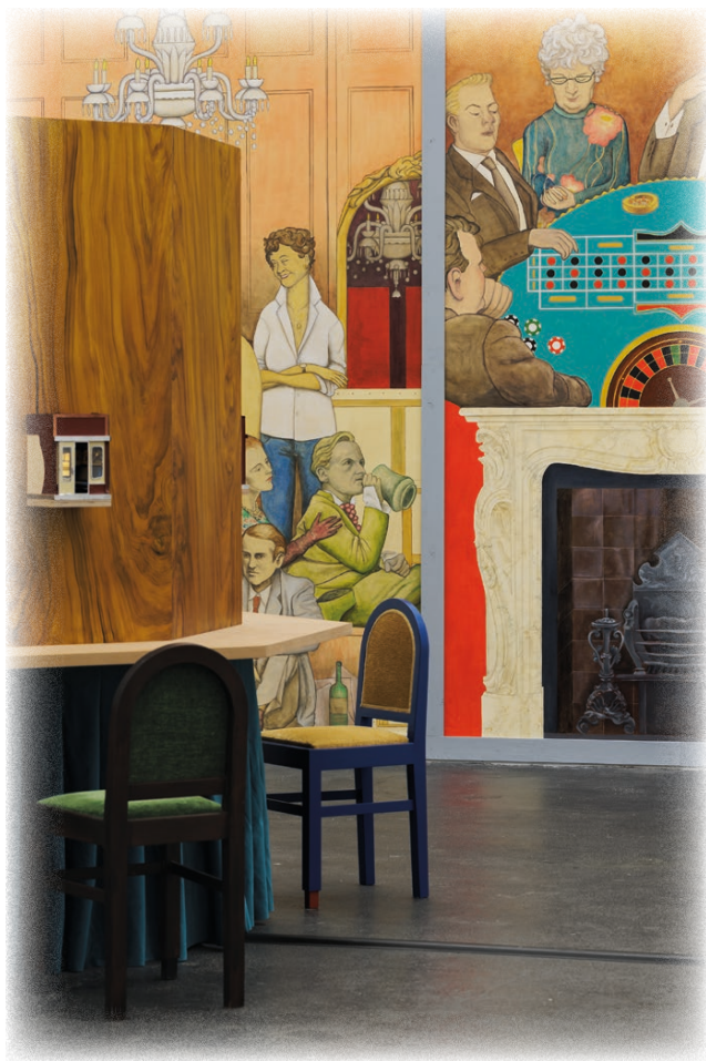
Vue de l'exposition «Lucy McKenzie: Plastic Newspaper», 2026, Crac Occitanie, Sète. En fond: "Mural for Cromwell Place (Francis Bacon's Studio)", 2024. Peinture à l'huile et acrylique sur toile, 300 x 600 cm. Courtesy de l'artiste, Galerie Buchholz, Berlin / Cologne / New York et Cabinet Gallery, Londres. A gauche: "Miniature Moving Panorama (Hudson Valley)", 2024. Structure en bois, modèles réduits de trains, textile, moteur, acrylique et huile sur toile, 4 chaises, 210 x 212 x 212 cm. Courtesy de l'artiste et Galerie Buchholz, Cologne. Photo: Useful Art Services.